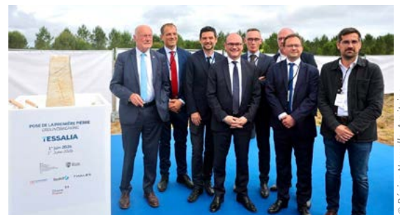
01/06/26 • Pose de la première pierre de Tessalia au Barp (33)

Lire l'article complet Contact : Julie Decoux