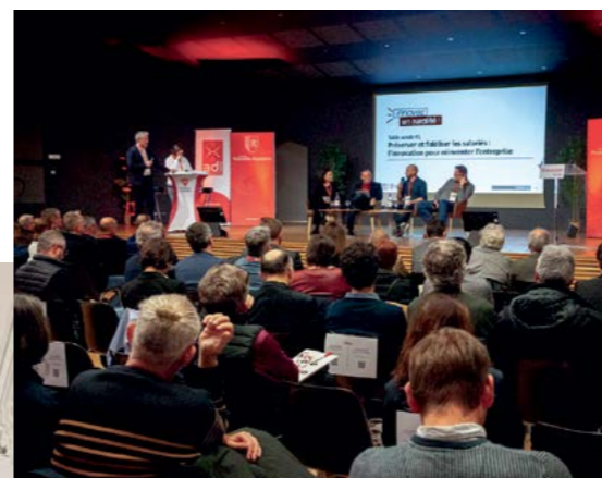
Rencontre Innovez en ruralité à Étagnac (24 novembre 2025)