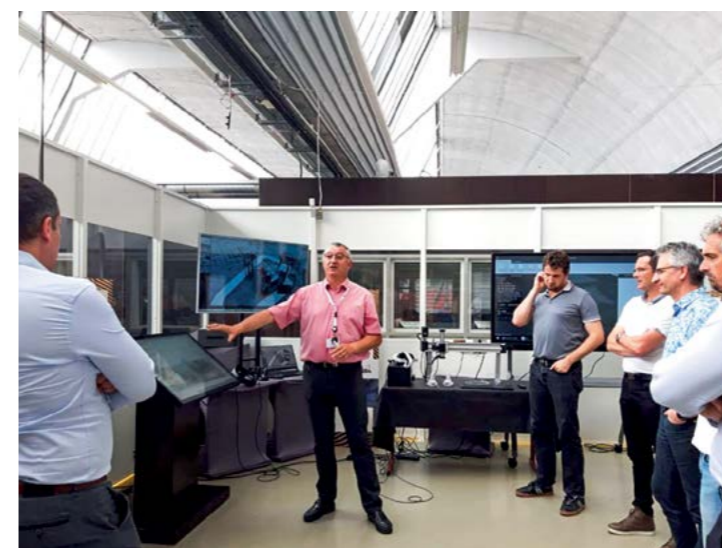
Visite du practice 4.0 de l'Usine du Futur