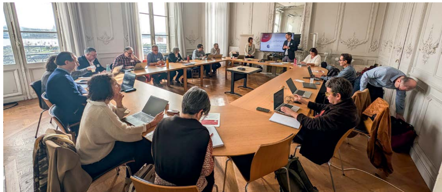
Rencontre des directeurs et directrices du développement économique des agglomérations adhérentes d'ADI (5 mars 2026)

Métropoles, agglomérations, communautés de communes ou urbaines... Partout en Nouvelle-Aquitaine, les territoires et leurs partenaires socioéconomiques reprennent leurs modèles et leur développement. Engagée à leurs côtés, ADI déploie une gamme d'outils et de services pour les épauler au plus près de leurs enjeux.