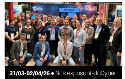
31/03-02/04/26 • Nos exposants InCyber

Cette ambition se traduit aussi à l'échelle nationale et européenne. Lors du Forum InCyber de Lille, événement de référence pour la sécurité et la confiance numérique, ADI anime le stand de la Nouvelle-Aquitaine avec le soutien du Conseil régional. L'objectif est double : promouvoir la diversité des solutions régionales et créer des opportunités business pour les entreprises du territoire. En 2026, 11 acteurs néo-aquitains ont ainsi présenté leurs offres et démontré leur capacité à répondre à des besoins opérationnels, souverains et immédiatement intégrables.