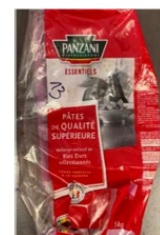
Emballage en PEBD ou PP