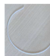
Tubes en PEHD