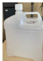
Bidon en PEHD-Multi-matériaux recyclables