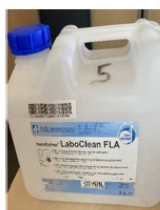
Bidon en PEHD