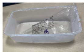
Barquettes en PP-Multi-matériaux recyclables