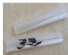
Capuchons en PEBD ou PP