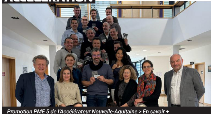
Promotion PME 5 de l'Accélérateur Nouvelle-Aquitaine > En savoir +